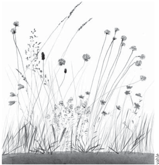
Heidenelken-Sandtrockenrasen, ein Lichtrassen auf trockenem Sandboden

● Stallapotheke: Offenbar führen die verschiedenen Standortqualitäten, die durch die einzelnen Lichtrassen-Gesellschaften „herausgearbeitet“ werden, auch zu unterschiedlichen und vielfältigen Stoffbildungen in den Lichtrassen-Pflanzen, was schon durch das reiche Vorkommen von Heil- und Gewürzpflanzen angedeutet wird: So finden sich hier beispielsweise Arnika, Katzenpfötchen, Augentrost, Wundklee, Küchenschelle, Thymian. Darin zeigt sich die besondere Wirkung der Lichtrassen als lebenswichtige Sinnesorgane einer funktionierenden Kulturlandschaft: Produktion von hochwertigem, diätetischen Aufwuchs zur Gesunderhaltung von Vieh und Mensch.