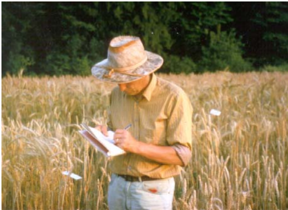
Der biologisch-dynamische Forschungsansatz bezieht den Menschen mit ein

klar formuliert dies Prof. Mengel in der Einleitung zu seinem mittlerweile in der 7. Auflage erschienenen (und von den Sachinformationen selbstverständlich empfehlenswerten) Standardwerk „Ernährung und Stoffwechsel der Pflanze“ (Mengel 1991). Er meint dort, es werde „immer deutlicher, dass auch die Vorgänge in der belebten Natur letzten Endes auf chemischen Prozessen basieren... Die Vorgänge, die sich im Mikrobereich der Moleküle, Atome und Elektronen abspielen, sind also letzten Endes auch für die mannigfaltigen Erscheinungen des Lebens verantwortlich.“ Aus dieser materialistischen „Philosophie“, die den Stoff als die Grundlage der Lebenserscheinungen ansieht, ist es verständlich, dass die sogenannte moderne Naturwissenschaft in dem genetischen Code die Grundlage allen Lebens sieht und enorme Anstrengungen (und natürlich auch staatliche Fördermittel) in die Erforschung und Nutzung der Gentechnik fließen.