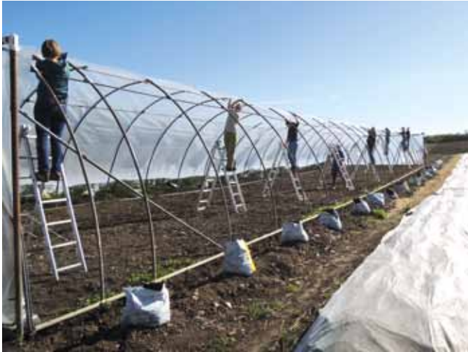
SoLaWi Erfurt e.V.

Viele Hände, schnelles Ende – in der SoLaWi wird gemeinsam angepackt.